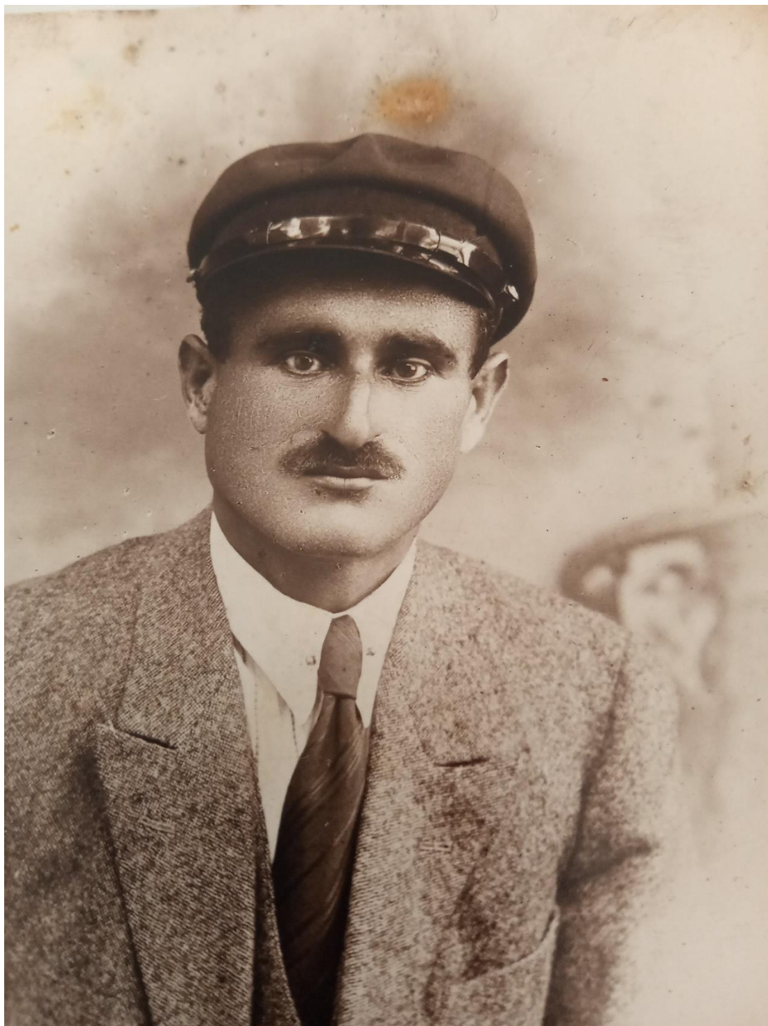
Φωτογραφία μέλους της οικογένειας Σούλιου.