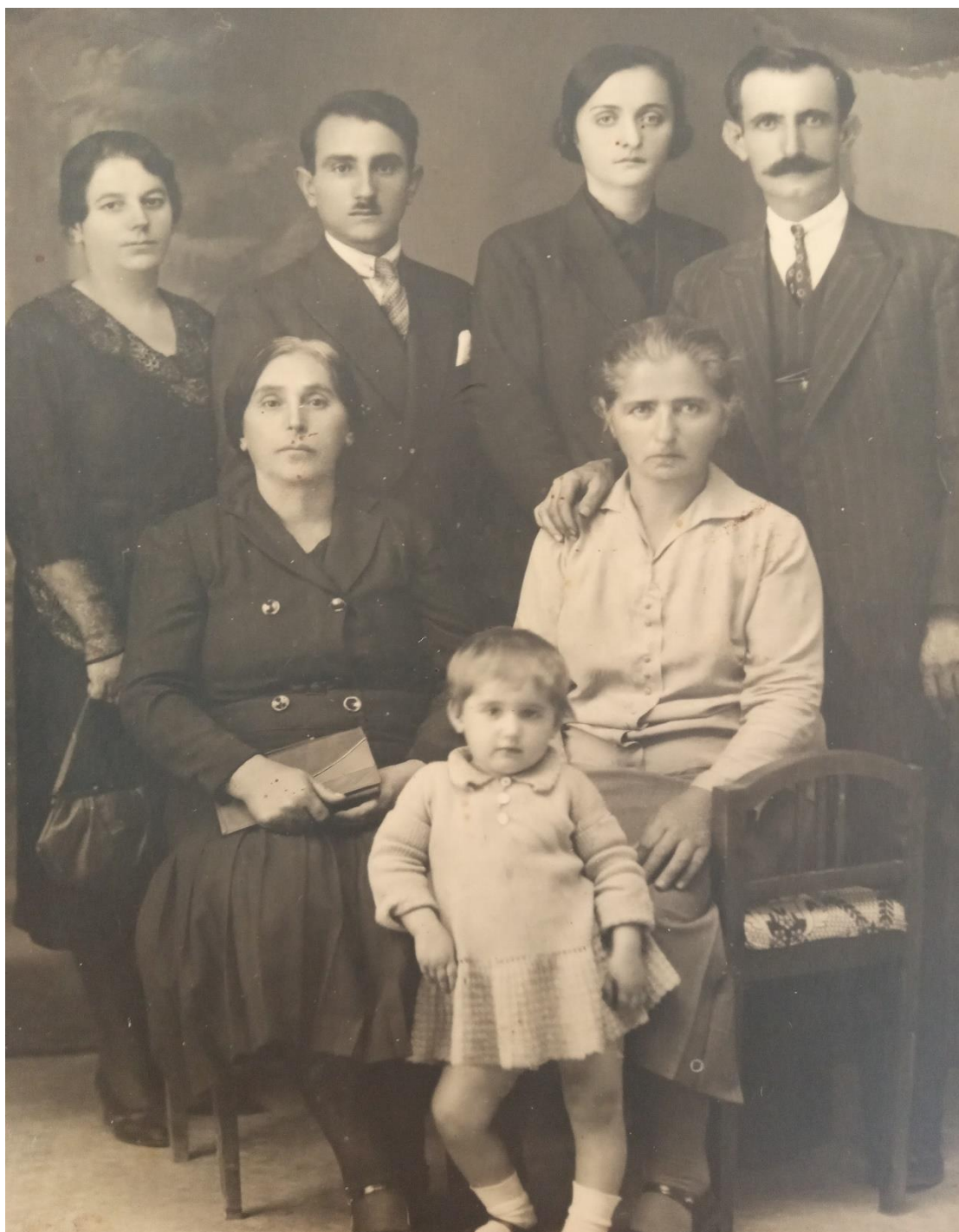
Αναμνηστική φωτογραφία της οικογένειας Σούλιου.