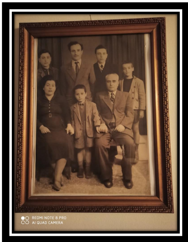
Αναμνηστική φωτογραφία της οικογένειας Βαρουζή.