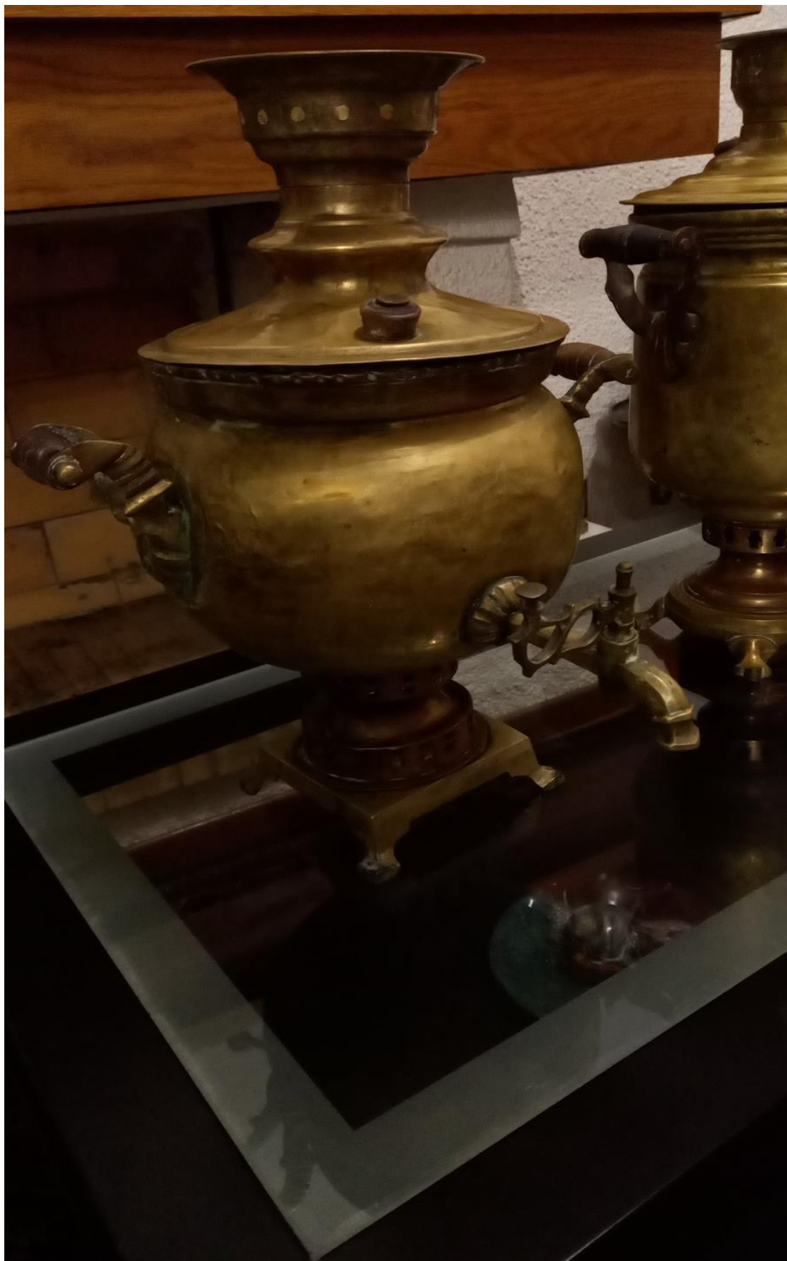
Σαμοβάρι. Το χρησιμοποιούσαν για να φτιάχνουν τσάι.