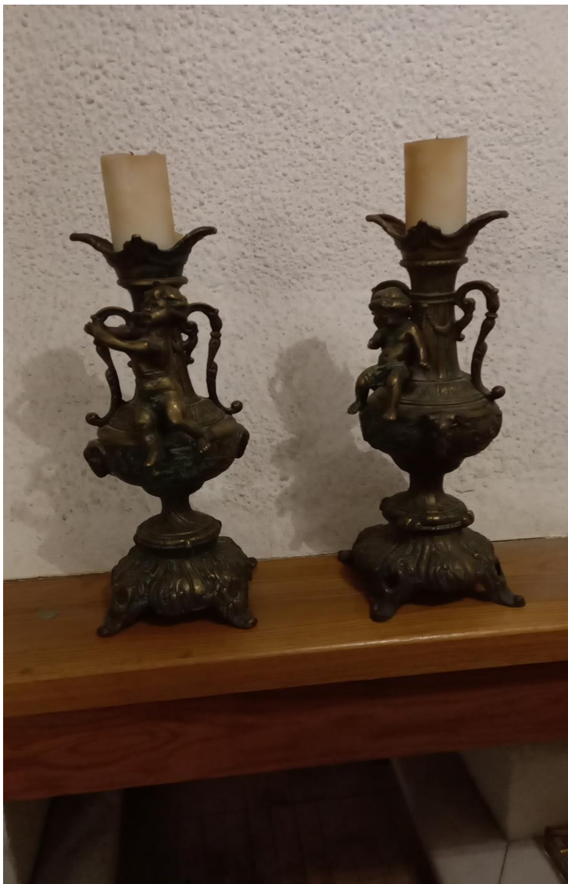
Κηροπήγια. Τα χρησιμοποιούσαν ως διακοσμητικό πάνω από το τζάκι, αλλά και για να βλέπουν.