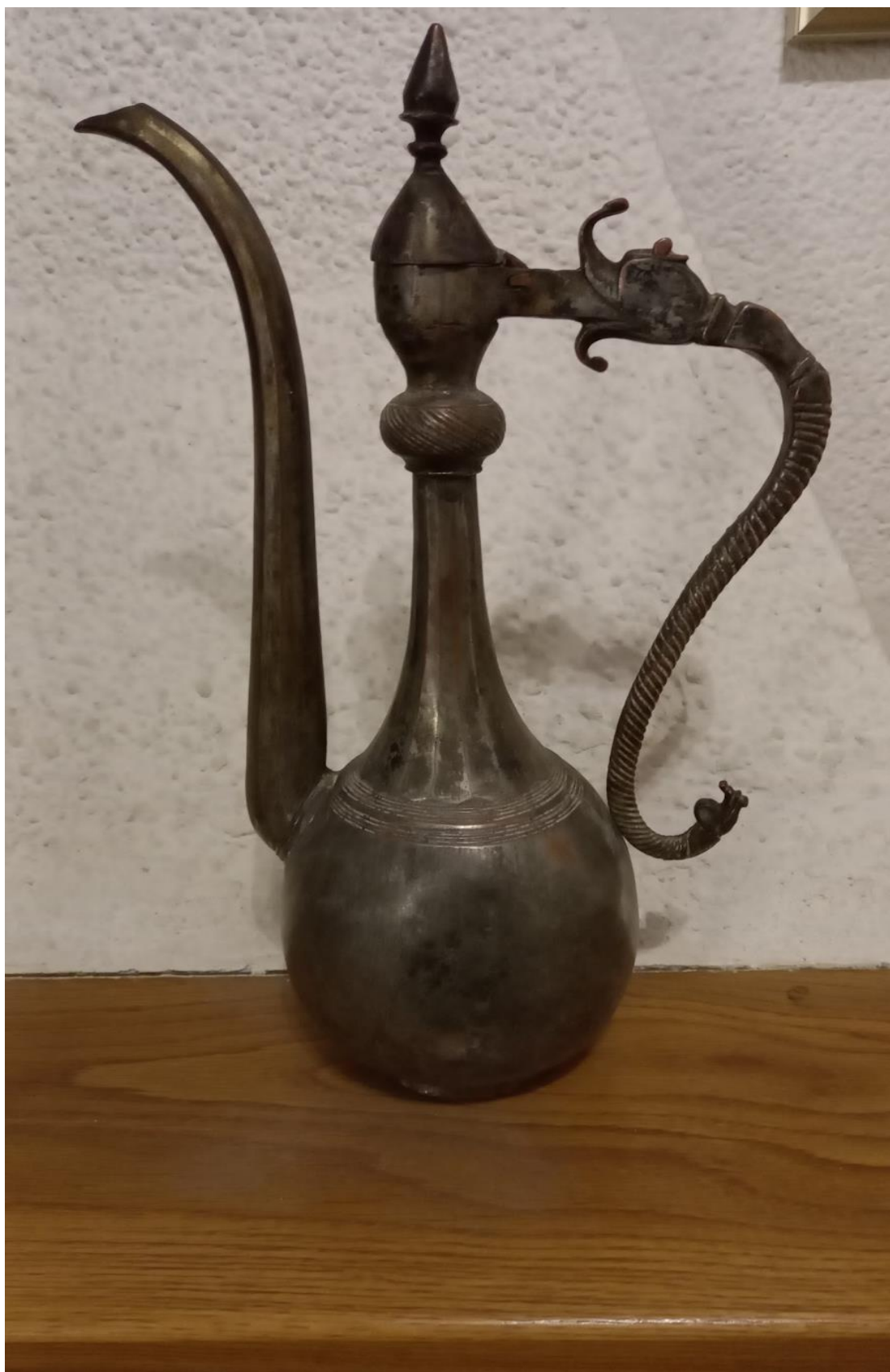
Δοχείο για κρασί. Το χρησιμοποιούσαν στα επίσημα τραπέζια για να σερβίρουν κρασί.