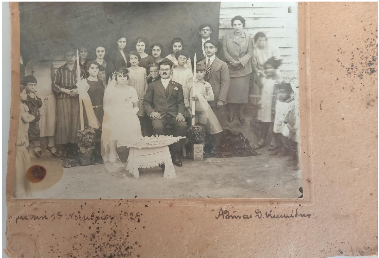
Αναμνηστική φωτογραφία από γάμο τον Νοέμβριο του 1925.