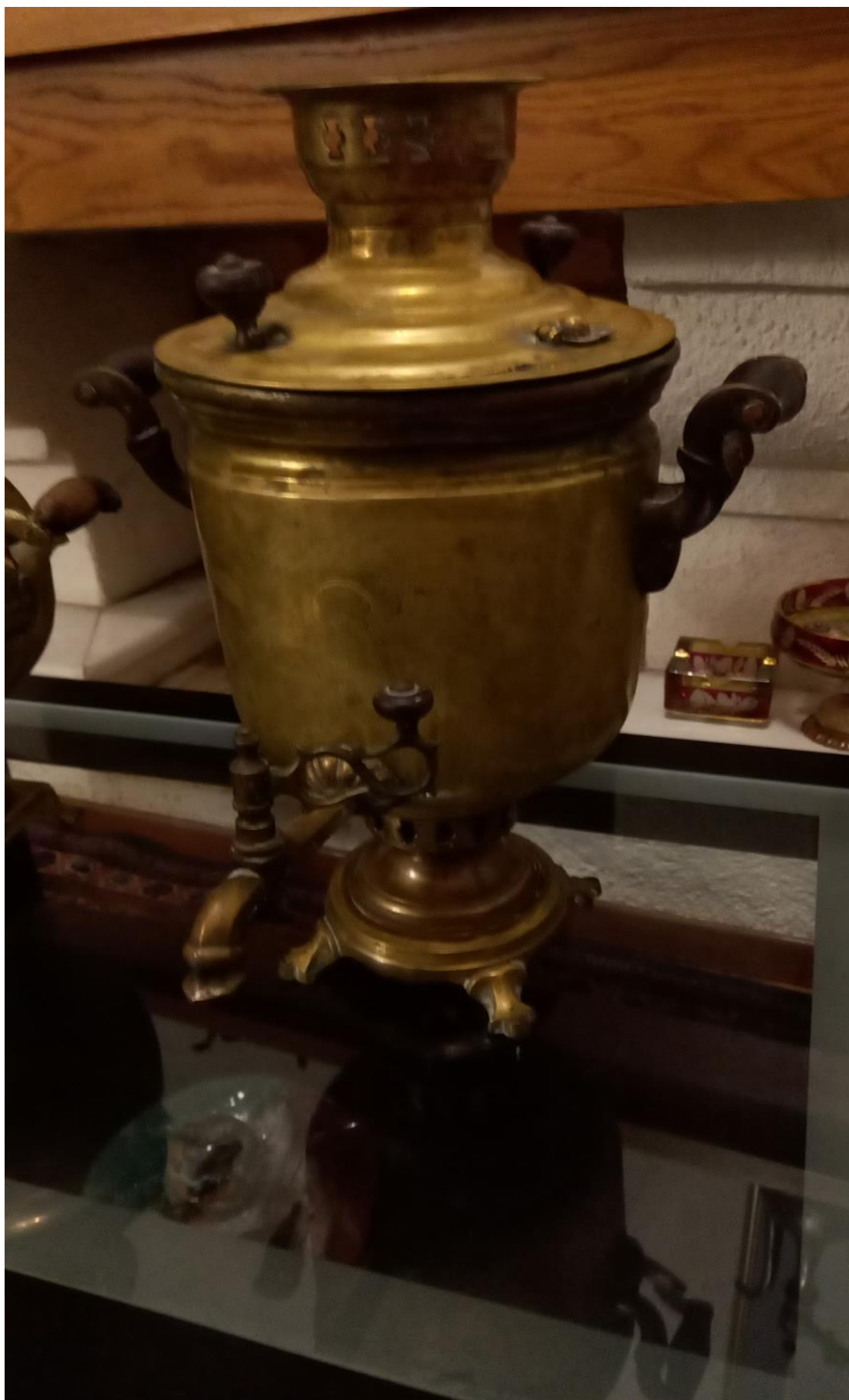
Σαμοβάρι. Άλλη άποψη του αντικειμένου.